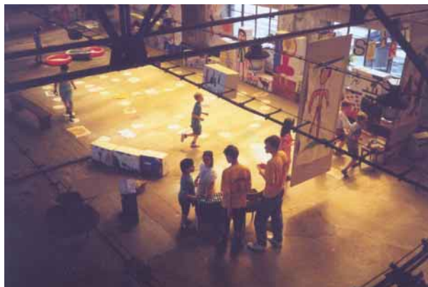
Týden dětské tvořivosti 97 (JUNIOR – DDM)

V r.1996 jsme uzavřeli písemnou smlouvu s vedením státního podniku Zetor, že můžeme uspořádat přímo v areálu Vaňkovky velkou kulturní akci – „Pro Vaňkovku“, na kterou se přišlo podívat více než 1000 lidí. Byl to úžasný zážitek, slavné zmrtvýchvstání! Město organizaci akce podporovalo a částečně ji spolufinancovalo. Zbytek dodal nebo dotoval soukromý sektor – stavební firma sídlící v sousedství pomohla upravit terén a půjčila elektrický kabel, pivovar Starobruno dodal sponzorsky pár soudků piva, atd... Velmi nám také pomohlo ocenění v soutěži o cenu Místa v srdci, které jsme získali koncem r.1996. Dodalo nám to další odvahy a chuť do práce a také z našeho hlediska veledůležitou finanční odměnu 100 000 Kč. Ta nám pak umožnila zprovoznit část prostorů v budově Modelárny před další sezónou. Odborníci ze Zetoru, kteří Vaňkovku důvěrně znali, nám na základě smlouvy provedli