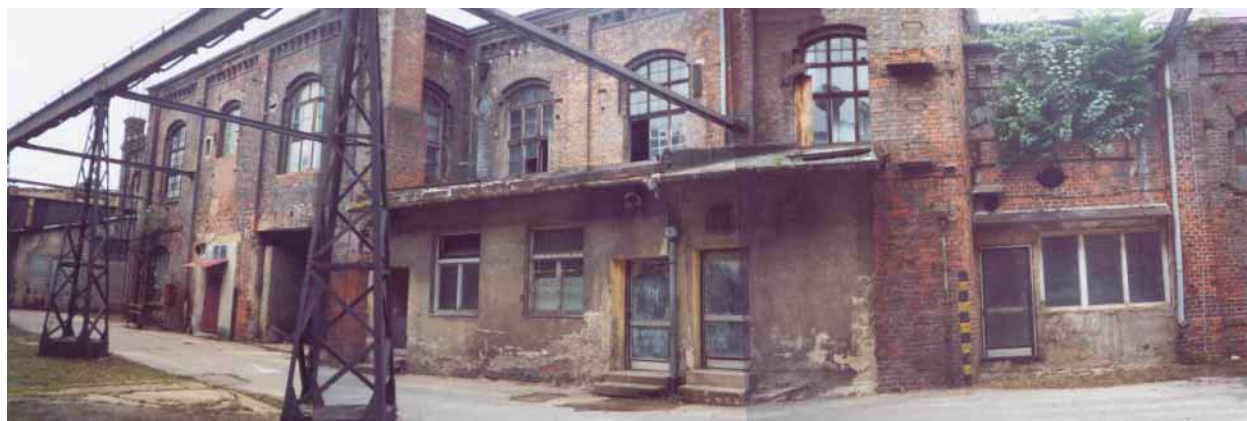
Fasáda šaten bývalé slévárny (budoucí Salon Vaňkovka)