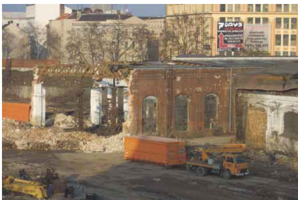
Bourání části jádrovny