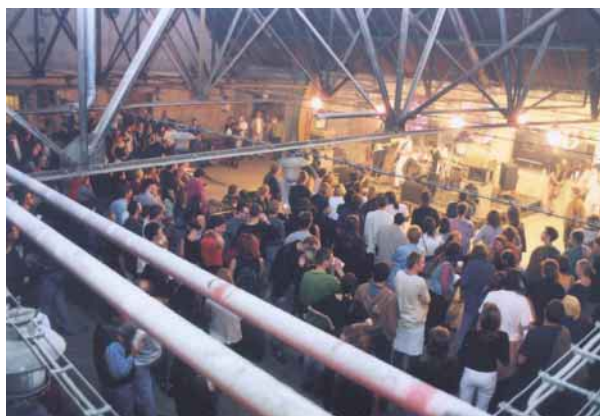
Hudba k 9. 9. 99