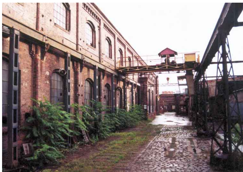
Strojírna a prostor pod jeřábovou dráhou

Rozhodli jsme se proto založit nadaci. V té době to byla nejjednodušší forma sdružení občanů. Cílem nadace byla zejména podpora záměru rekonstrukce a oživení areálu Vaňkovka v Brně pro obchodní, kulturní a vzdělávací účely. Naším vkladem do nadace bylo v počátku ovšem pouze naše nadšení a pracovní nasazení. Pak nám ale