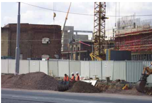
Stavba nákupní Galerie Vaňkovka