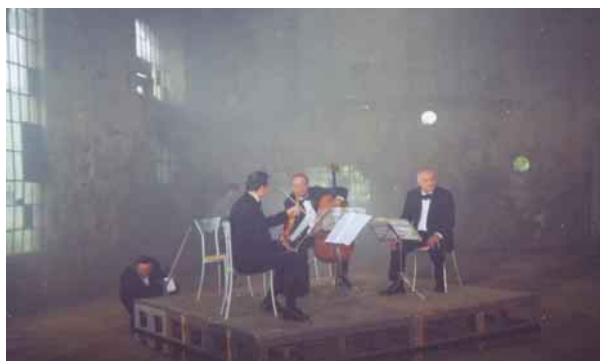
ČT Brno natáčí v Jádrovně