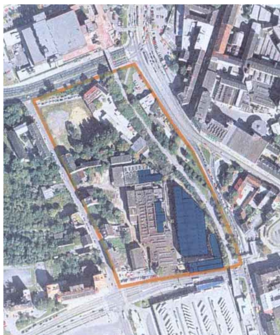
Modře – zachovaná část areálu

Vaňkovka přináší do 21. století poselství tvořivosti a lidské spolupráce. Právě tyto vlastnosti nám pomohou uspět v konkurenci EU. Širším cílem našeho záměru je ovlivnit také využití nyní městského majetku – zrekonstruované Strojírny – pro veřejné účely. Považujeme za optimální realizovat v tomto objektu centrum interaktivního vzdělávání mládeže, které pracovně nazýváme Studio Vaňkovka. Je to rozsáhlý projekt uskutečnitelný pouze na základě širokého partnerství a s pomocí strukturálních fondů EU. Na přípravě tohoto projektu spolupracujeme s JUNIOREM – Domem dětí a mládeže za morální i finanční podpory Jihomoravského kraje již déle než dva roky. Projekt tohoto druhu však potřebuje spolupráci a podporu mnoha institucí včetně zastupitelstva Statutárního města Brna. Součástí našeho záměru, který jsme předložili JCB a.s. je proto návrh založení nového právního subjektu, který bude schopen řídit další přípravu projektu a posléze jeho provoz.