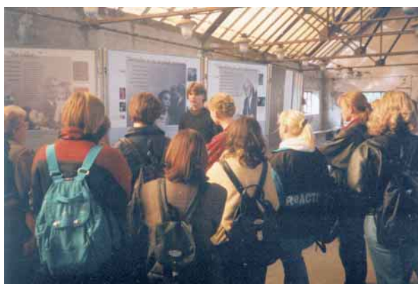
Anna Franková – odkaz pro současnost