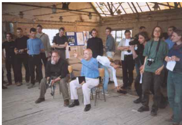
Mezinárodní studentský workshop 1999

Nakonec ale vše dopadlo jinak: Aktivity našeho sdružení Vaňkovku nejen zdokumentovaly a zviditelnily, ale pomohly ji také vyřešit složitý vlastnický problém. Naši činnosti se zvýšil společenský potenciál a tím i komerční