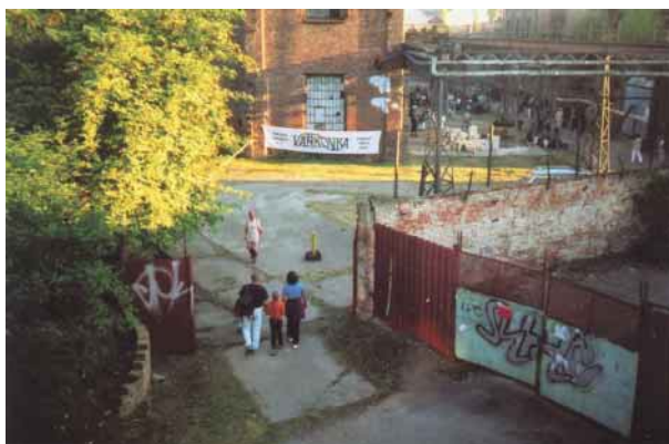
Dny evropského dědictví 2002