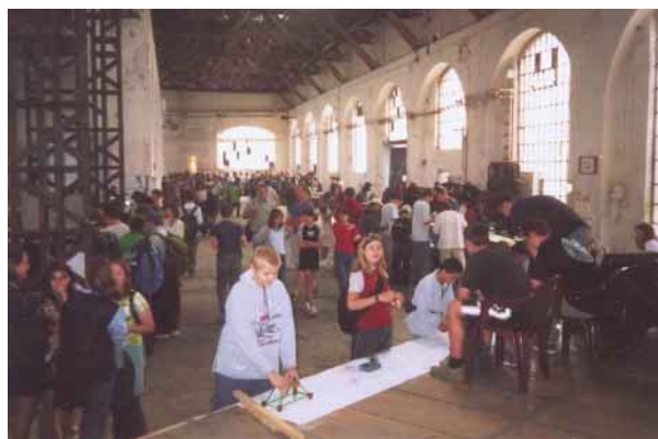
Heuréka 2002 – vědecká herna v Jádrovně