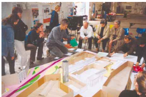
Plánovací víkend 2001