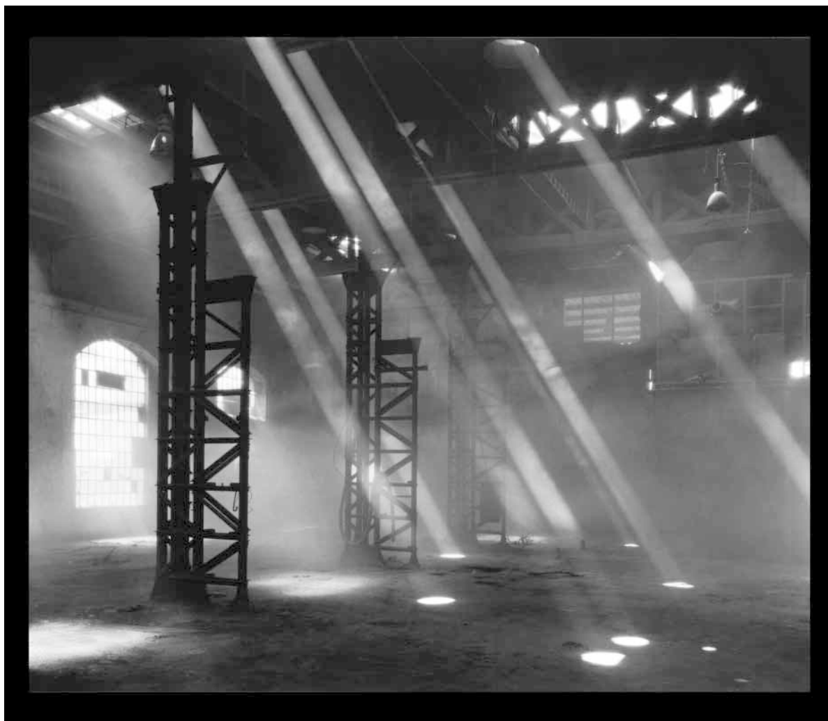
Světla v jádrovně

V této příloze demonstrujeme, jak důležitou tvořivou a vizionářskou roli představuje občanská iniciativa a neziskový sektor právě v procesu regenerace místních brownfields. Příloha je prezentována Občanským sdružením Vaňkovka, které se po dobu 10 let angažovalo ve znovuvyužití tohoto areálu. Příběh dokazuje, že znovuvyužití brownfields je běh na dlouhou trať, plný zvrátů a nutných kompromisů.