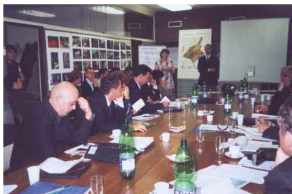
Experti, město a ECE – listopad 2001